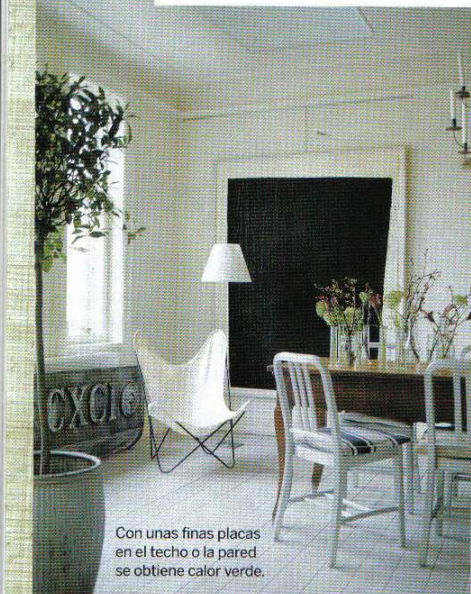
Con unas finas placas en el techo o la pared se obtiene calor verde.

Los pequeños gestos cotidianos, como utilizar cosmética o prendas bio , son grandes.