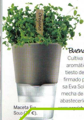
Maceta Eva Solo (17 €).

es el país más verde, limpio y sostenible del mundo. Le siguen Suecia, Noruega y Finlandia. España está a la cola, en el puesto 30.